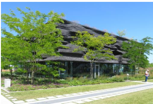
Flevolands paviljoen Food Forum